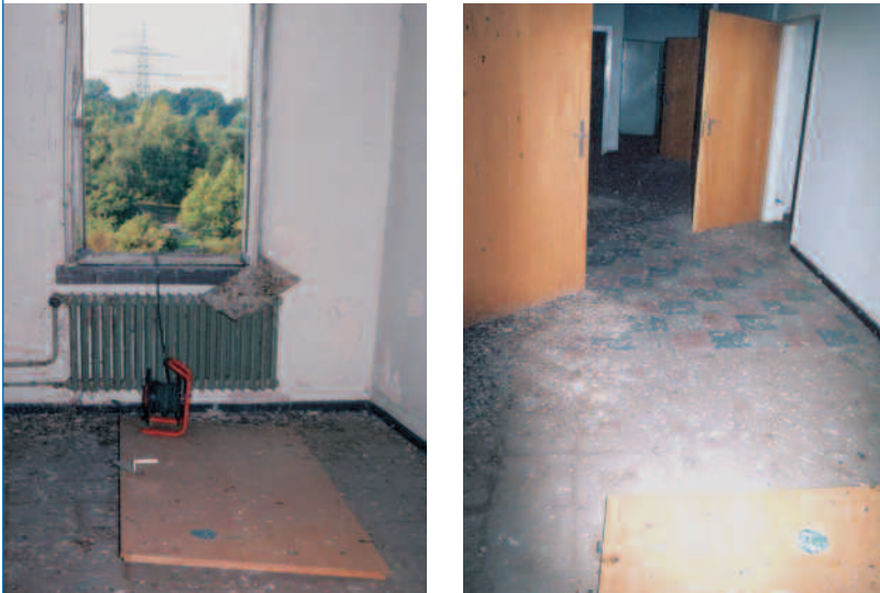
Abbildungen: 3 a, b. Taubenkotkontamination, die gut absaugbar ist

Die Reinigung dieser Arbeitsbereiche sollte daher nicht unter Verwendung von Schaufeln und Besen, Hochdruckreinigern oder durch Abbürsten (s. Abbildung 2) geschehen, da Mikroorganismen bei den beschriebenen Tätigkeiten zusammen mit Staub- oder Flüssigkeitspartikeln verstärkt in die Luft freigesetzt werden.